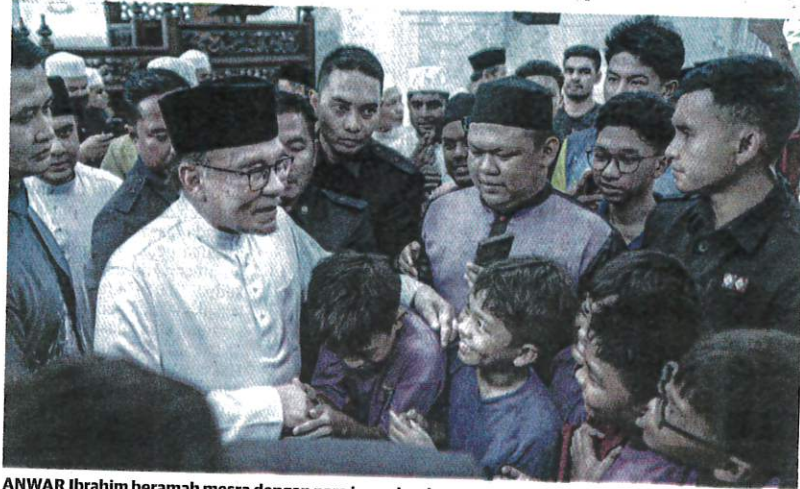
ANWAR Ibrahim peramah mesra dengan para jemaah selepas menunaikan solat Jumaat di Surau Al-Manar Presint 14, Putrajaya semalam.

surans perubahan meluahkan rasa tidak berpuas hati ekoran kenaikan kadar premium yang dikenakan antara 40 sehingga 70 peratus bermula tahun depan.