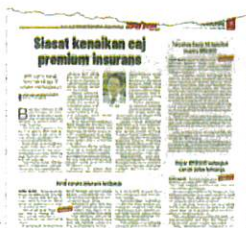
Laporan Sinar Harian pada 28 November lalu.

su kenaikan caj premium insurans sekitar 40 hingga 70 peratus yang dikenakan terhadap pengguna masih dalam proses rundingan semula.